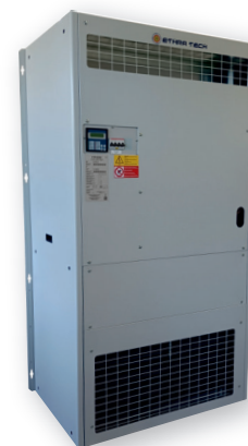
L'immagine sopra riportata è puramente a titolo indicativo The image above is purely indicative

Indoor packaged air conditioning units air cooled type, ideals for installations inside room, shelter for radio base station and data processing centre.